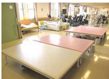
利用者様一人一人の状態に合わせたリハビリ

理学療法士・作業療法士が1人1人の状態に合った個別的なリハビリを提供し、自立への支援をお手伝い致します。