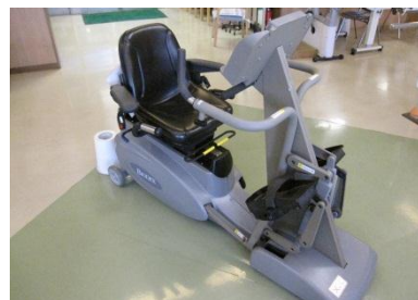
全身エクササイズマシン