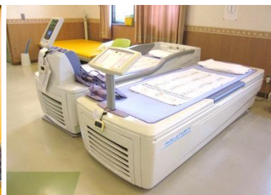
水圧によるマッサージ器

～「リハビリ専門職による個別リハビリ」や「マシンを使った運動」等 充実したサービスを提供致します。～