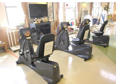
またぐ必要のない乗り降りの楽なエアロバイク

軽い負荷での運動を反復して行うことで、普段使っていない筋肉の再活性化や、日常生活に必要な正しい動作の再学習を図ります。重い負荷をかけて行う筋力トレーニングとは異なる為、どなたでもご利用できます。