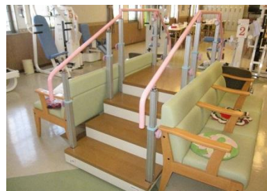
住環境に合わせたリハビリ